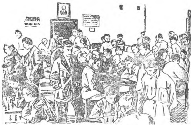
В шахзале. 1928 г.