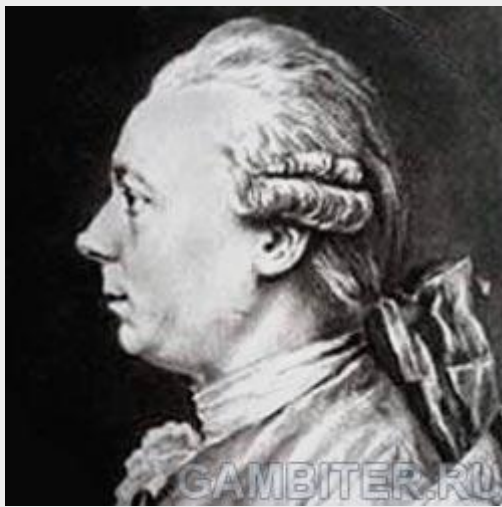
Франсуа-Андре Даникан Филидор