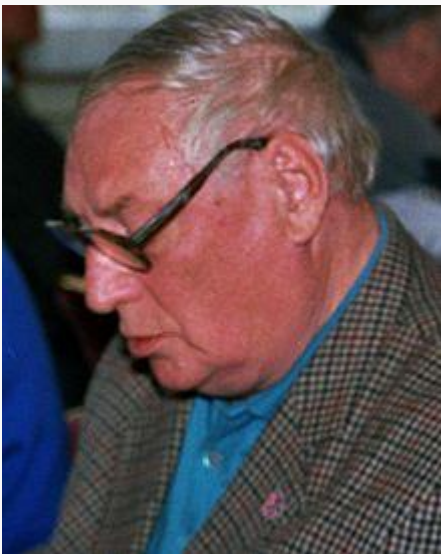
В 1995 году