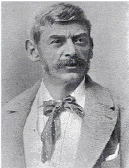
Адольф Альбин в 1895 году