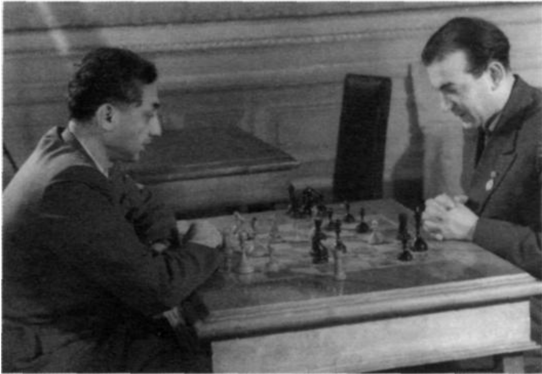
С чемпионом СССР 1960 года В.Корчным