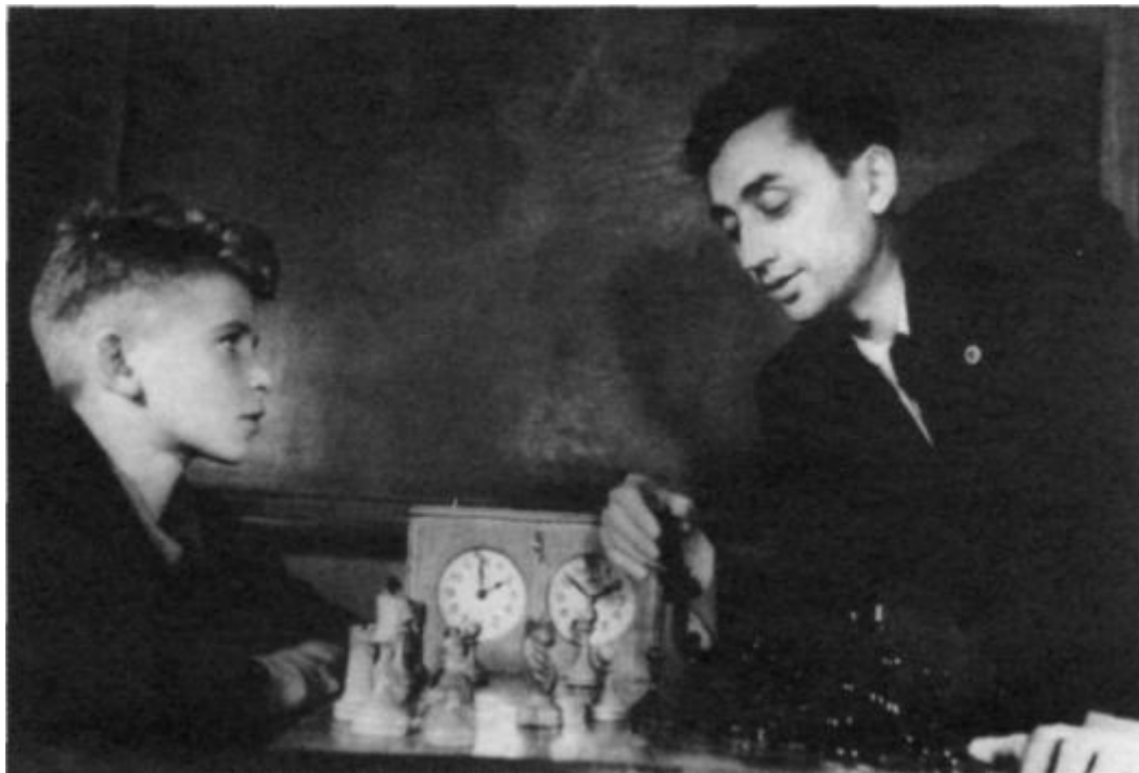
С Борисом Спасским, 1948 год