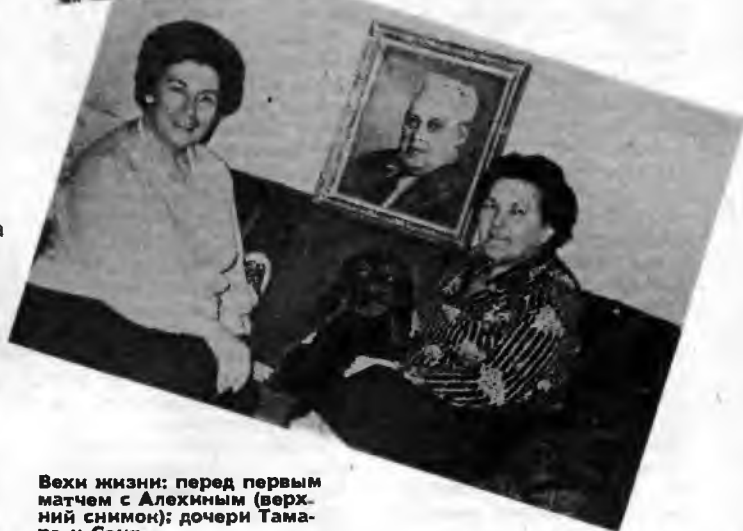
Вехи жизни: перед первым матчем с Алехиным (верхний снимок); дочери Тамара и Соня.

Cd7 29. Lb1 Ce6 30. h3 Kf6 31. Lf3 d4 32. A : f5 de 33. Lg1 ed 34. A : f6 Le8+. Белые сдались.