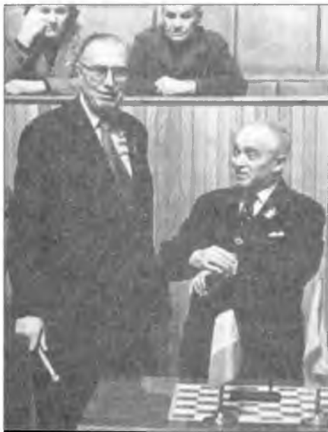
М. Эйве и С. Флор

Он отличался твердостью спортивного характера. Был своего рода рекордсменом по количеству сыгранных матчей. Сыграл более тридцати матчей с сильнейшими шахматистами мира. Причем отдавал дань единоборству на всех этапах