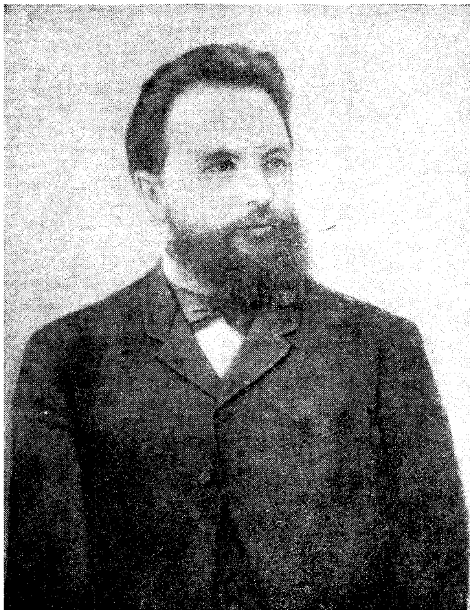
М. И. Чигорин